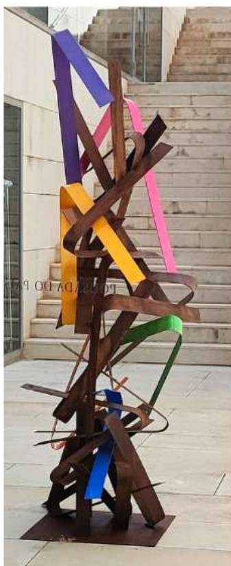
Clip's 230 x 90 x 90 cm 6 150€