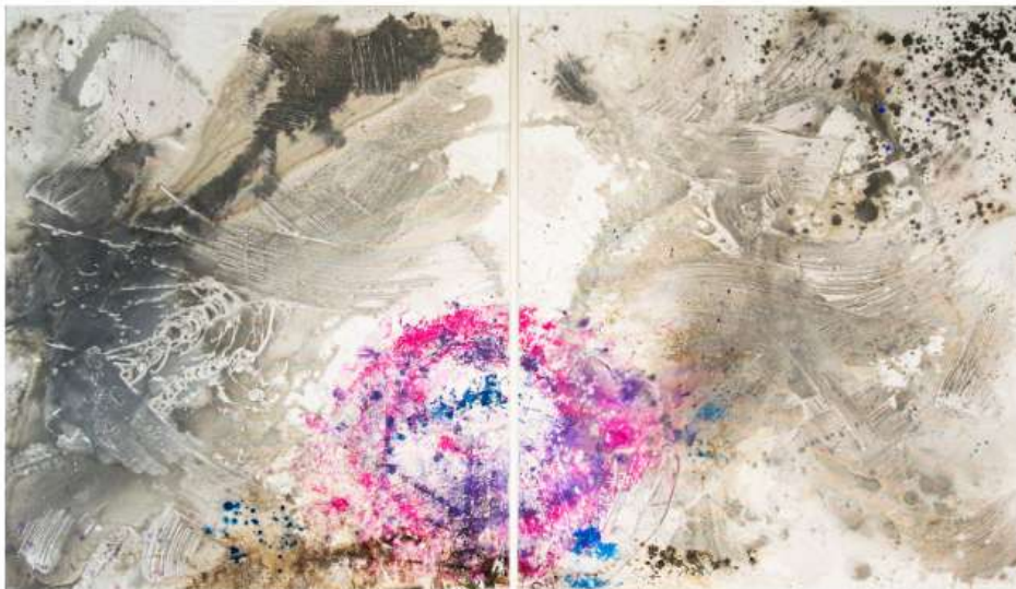
Pink Storm 140 x 120 cm (x2) 5150€