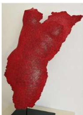
Mara 47x40x20cm 2 950€