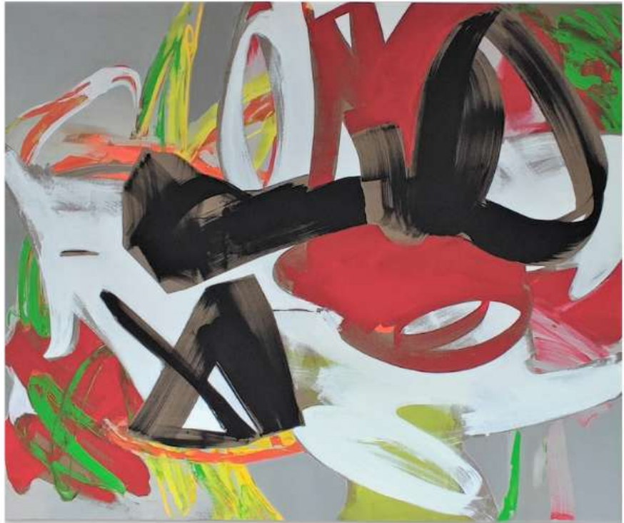
Grey 180 x 170cm 6 250€