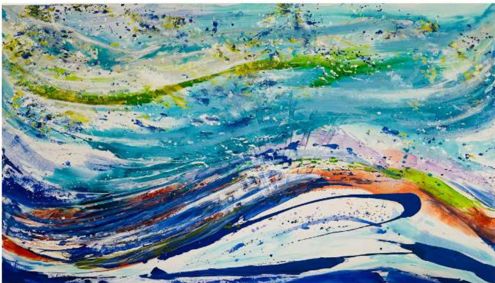
Akoya 255 x 135 cm 11 950€