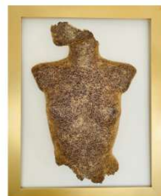
Baya 84x64cm 2 950€