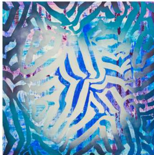
Bispo 120x120 cm 4350€