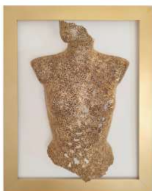
Tessa 84x64cm 2 950€

Born in Nantes, France (1971), she has lived in Portugal for almost 30 years. The artist made a career in painting, but it was in sculpture that she found her greatest art. In 2011 she fell in love with cardboard. The lacy cardboard technique associated with the delicacy and movement of the female body are her great inspiration. Her work has been exhibited in Portugal, France, Switzerland, Denmark, the United States and Canada.