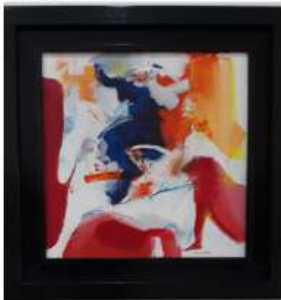
O Carrocel 50x50cm 1 950 €