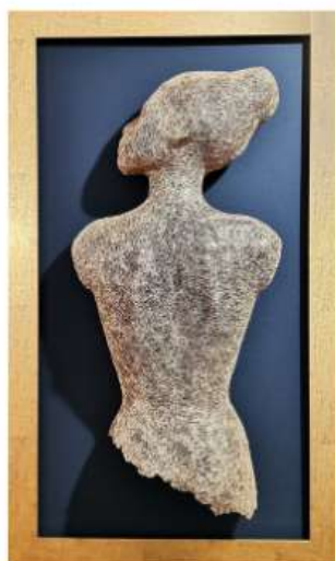
Misty 85x42cm 3 450€