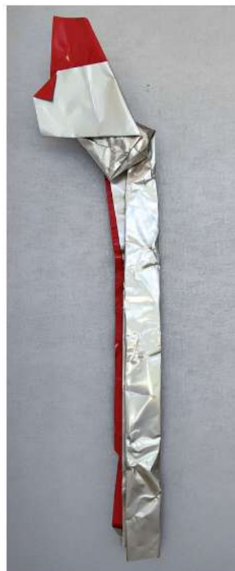
1224 200 x 45 cm 2 550€