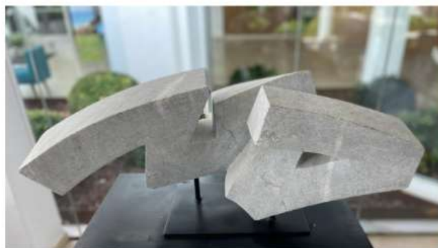
Horizonte Construido 35 x 73 x 30 cm 3 250€