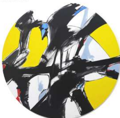
Na Brincadeira 150 x 150cm 6 950€