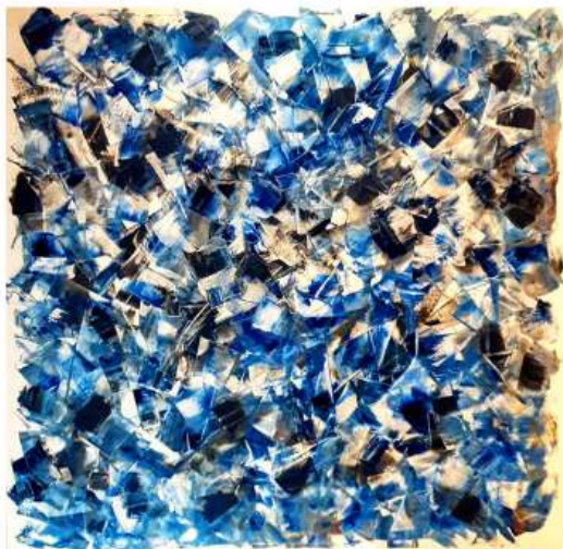
Shrapnel 150 x 150cm 22 250€