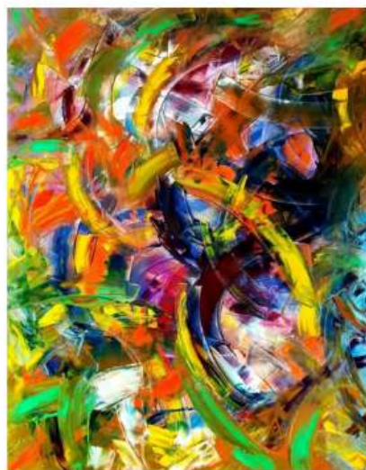
Phoenix 100 x 80cm 5 250€