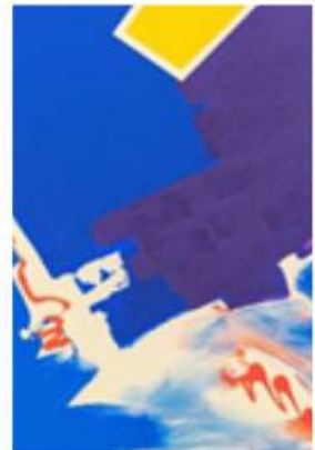
Entropia 1 150 x 120 cm 2350€