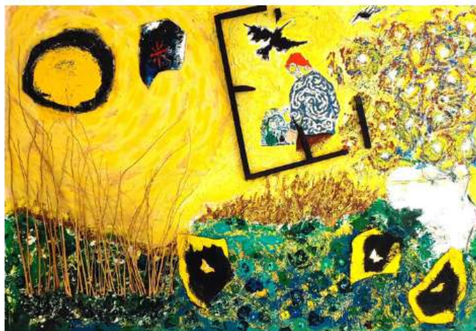
Vincent died for our sins 260 x 130 cm 13 950€