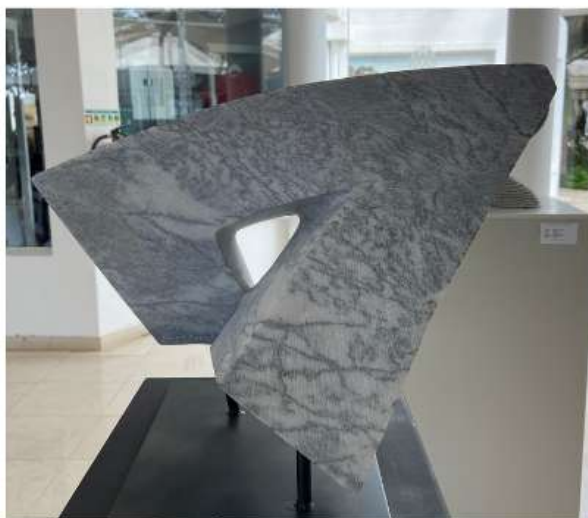
Triangule 35 x 47 x 37 cm 2 150€

Born in 1978, he made his first sculpture at the age of 16 and, since then, this has been his main form of expression. The tree is his reference element, symbol of life and longevity, an element that he likes to embody in stone and marble. The artist collaborates with several galleries and is represented in several public and private collections.