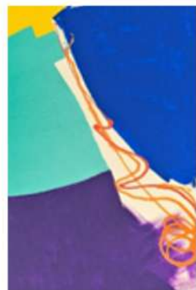
Entropia 2 150 x 120 cm 2350€