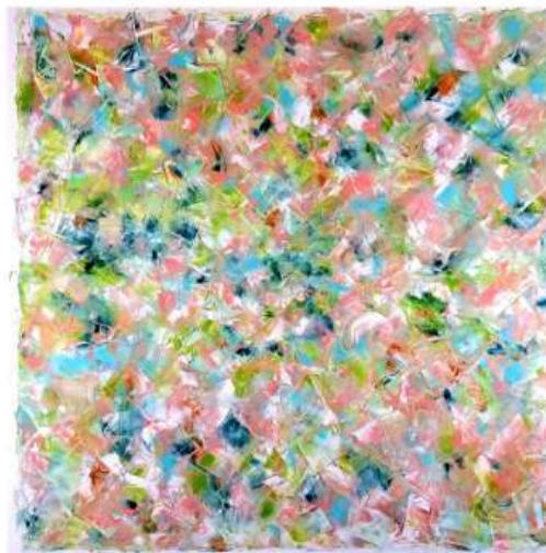
Morpheus 150x150cm 22 250€