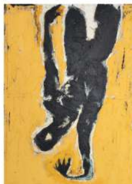
Acrobate 180 x 130 cm 6 450€