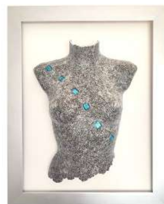
Mia 80x64cm 2 950€