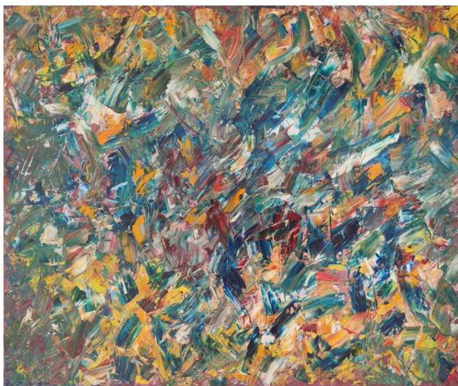
Feeling Good 100 x 120cm

Born in Faro in 1975, began her artistic journey at 14, exploring oil painting. Infused with emotion, her creations intricately weave feelings and events through color, texture, and rhythm. In 2018, she turned her passion into a profession, exhibiting at prestigious venues, including the 9th Beijing International Art Biennale and 4th Gaia International Art Biennale.