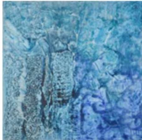
Gema 100 x 100 cm 2 950€