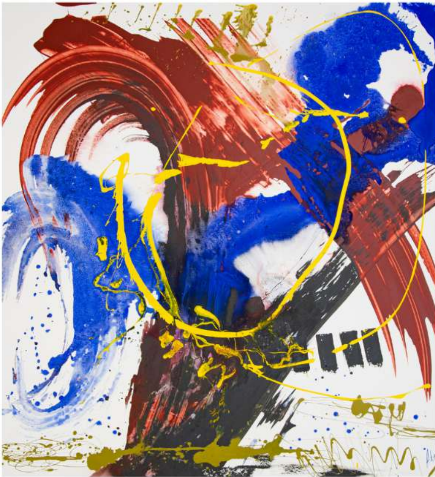
Revelation 200 X 200 cm 12 950€