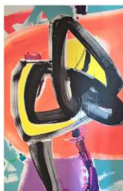
Laranja 100 x 150cm 2 850€