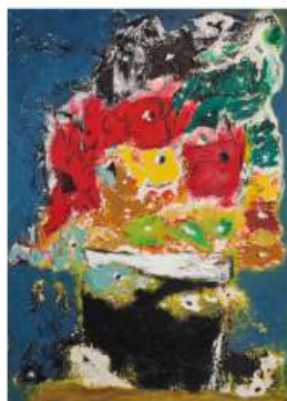
Aquário 180 x 130 cm 5 950€

Born in 1974, he embarked on an immersive journey through the arts, exploring the Alentejo and the Algarve regions, until in 2015, he embarked on an intimate and spiritual journey of self-discovery. It was at this point that he channeled his artistic expression into painting.