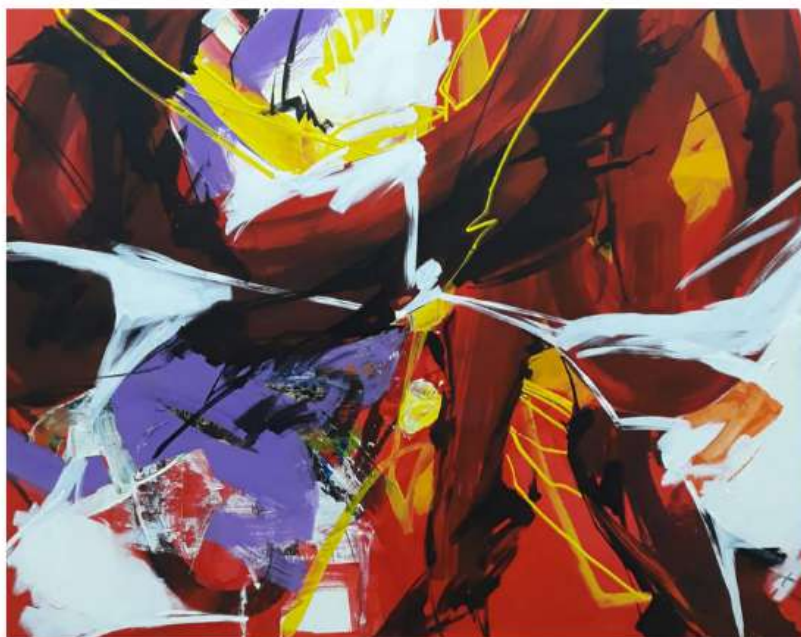
Momentos 170 x 170cm 6 950€