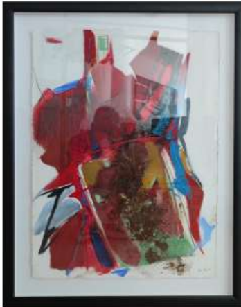
Café 100x80cm 3 250€

Born in Porto, where she attended ESAD, and graduated from the Toronto School of Art, her work is represented in a wide range of areas, from philately to filmography. She has exhibited all over the world (solo and group exhibitions), namely in the United States, France, Canada, Italy, Germany, Spain and Portugal. The artist work is marked by colour, gesture and audacity.