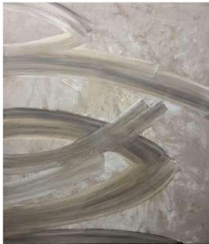
Jungle 140 x 120 cm 3 950€