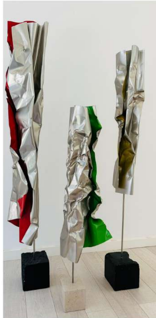
Red 130 x 20 x 20 cm 3 350€ Green 120 x 20 x 20 cm 2 450€ Yellow 120 x 20 x 20 cm 2 450€