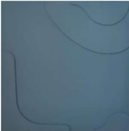
PZ 100 x 100 cm 1 850€