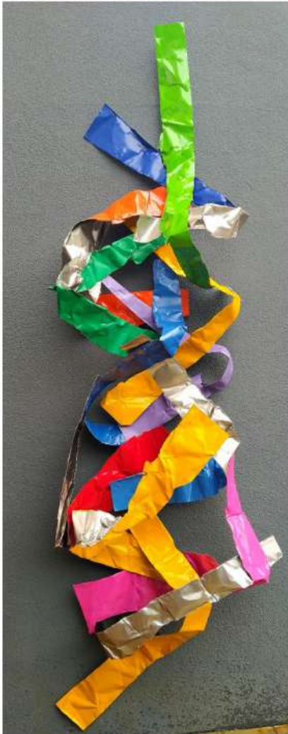
Desorientation 265 x 90 x 35 cm 5 650€